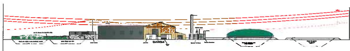
Figure 2 Vue en coupe de l'installation